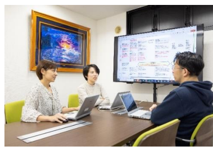
子育てにも仕事にも全力投球な、当社のパパ・ママワーカーたち