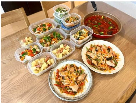
社員（4人家族）が料理代行で4日分の食事を依頼

「退勤後に家族に必要な栄養を考えて料理をするのが大変だったが、健康面を考えた料理を作り置きしてもらえて安心だ」